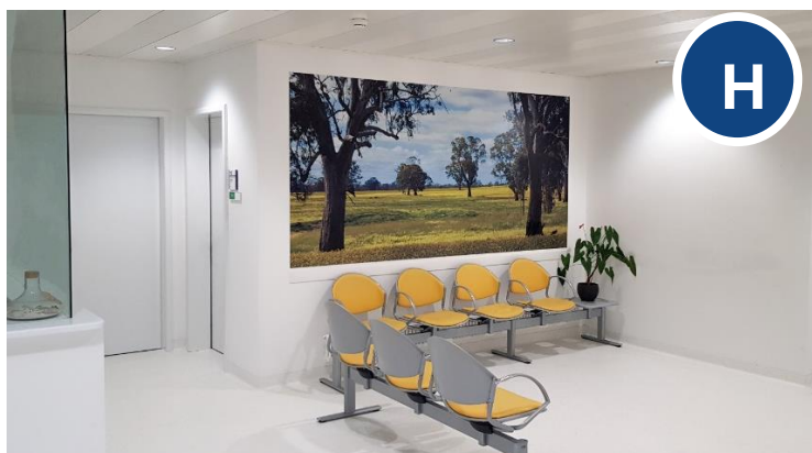
Sala d'attesa ambulatorio mielolesi presso lo stabile "H" -2.