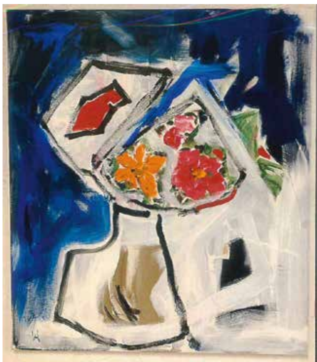
Fiori - 2024 - acrilico su tela, 70 x 70 cm

Dipingere (o anche dare forma a figure e oggetti "scultorei") diventa allora una sorta di esorcismo teso ad un nuovo inizio, ad una nuova vita. La chiave che schiude a Vanna Alberti i suoi risultati è quella di un amore palpitante e senza riserve per gli esseri che affollano il suo personale teatro (o forse, "corte dei miracoli"): creature di pari grado che siano fiori,